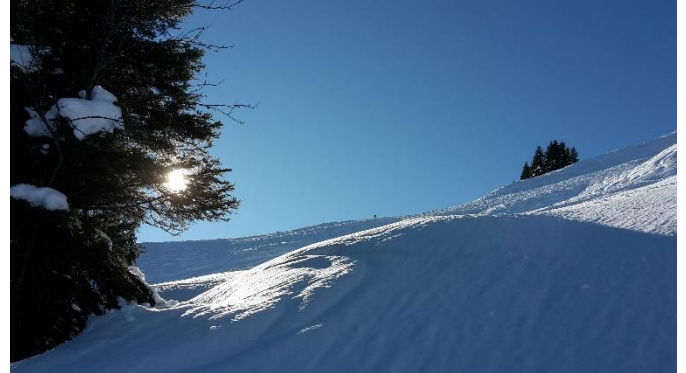
Heiligabend 2017 im Aufstieg zum Rangiswanger Horn