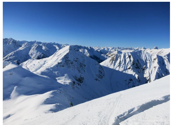
14.01.18 Namloser Wetterspitze – ein Wahnsinn, und das bereits im Januar!