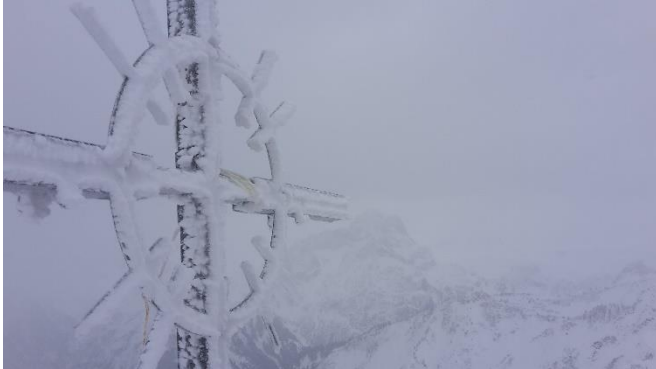
26.11.17 am Grnhorn mit Blick gen Widderstein

Schon wieder vorbei, die offizielle Schneeschuhsaison im Winter 2017/2018. Aber immerhin, es war ´mal wieder ein Winter – auf jeden Fall einer mit frhem Beginn. Hier Impressionen einiger Touren.