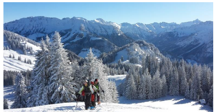
29.12.17 Tiefenbacher Eck – Neuschneefreuden pur!